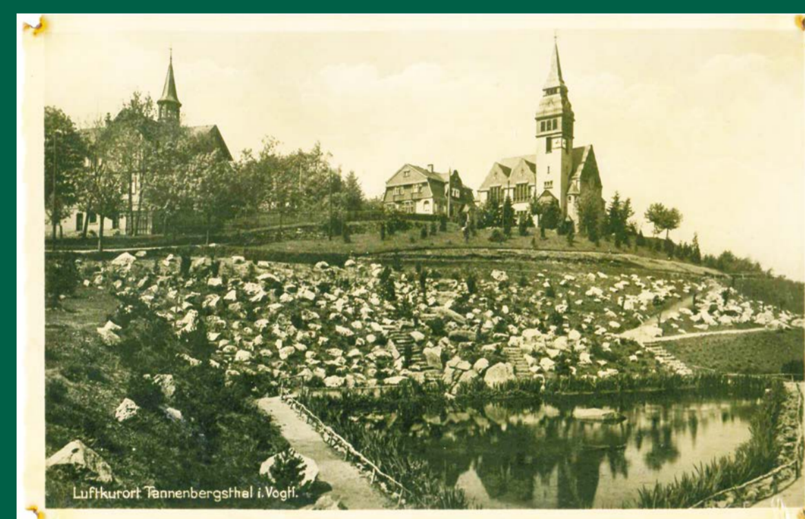
Ansichtskarten um 1930.