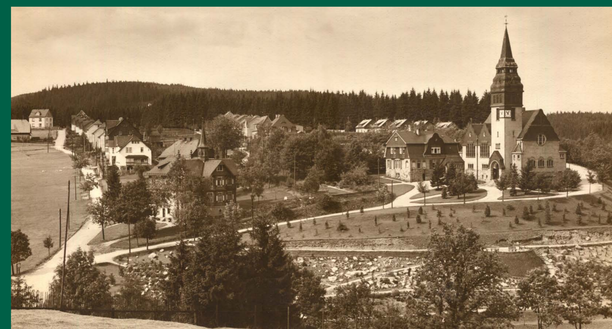
Der Steingarten in den 1930iger Jahren.

Besondere Gehölze bekamen einen Platz, so zum Beispiel die aus Nordamerika stammende Weymouths Kiefer offizieller Staatsbaum der US-Bundesstaaten Maine und Michigan. Manche fremdländische Arten im Steingarten, wie die Rot-Eiche, sind in Europa längst heimisch geworden.