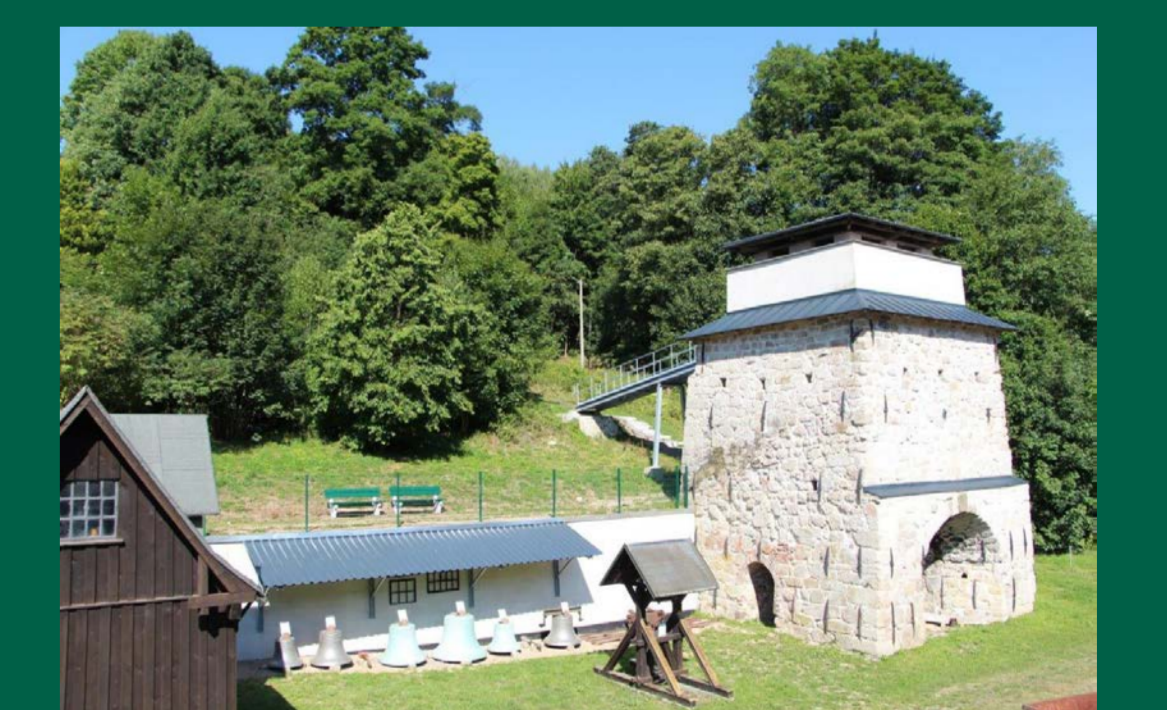
Das Eisenwerk in Morgenröthe. Als Technisches Denkmal kann der Hochofen der Glockengießerei besichtigt werden.

Hallo Kinder, scann den QR-Code und fliegt über den Steingarten. Euer Topasius