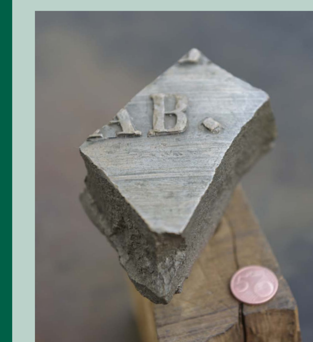
Erhaltenes Stück der zerschlagenen c-Glocke.

Zu Ostern 1942 hallte der Bronzeklang das letzte Mal. Zwei Glocken wurden zerschlagen, abtransportiert und für die Kriegsrüstung eingeschmolzen.