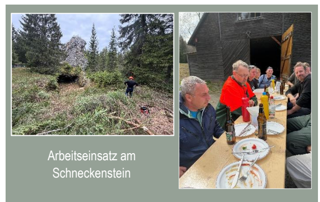
Arbeitseinsatz am Schneckenstein