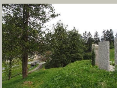
Steingarten in Tannenberghthal