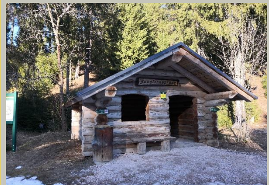
Hütte am Jungfernsprung