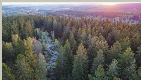
Wendelstein am Felsenweg 3b

Geo-Umweltpark Vogtland Dr.-Wilhelm-Külz-Str. 25 08223 Falkenstein/Vogtland www.sagenhaftes-vogtland.de