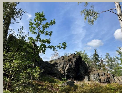
Die drei Katzensteine (Morgenröthe - Rautenkranz, Auerbach und Falkenstein)