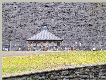
Schieberhaus Talsperre Werda