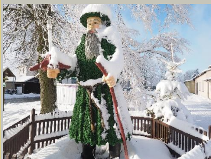
Moosmännchen in Grünbach

Wir bedanken uns für das gemeinsame Jahr und wünschen eine besinnliche Weihnachtszeit.