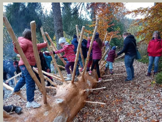
Einweihung des Martin – Holzlebniswegs durch den Sächsischen Staatsfort am Felsenweg 5