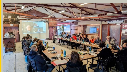
AdG Sitzung im November, Grube Fortuna im © NGP Geopark Westerwald-Lahn-Taunus.

Ein aufregendes Jahr geht zu Ende. Sehr viel haben wir erreicht, dank Ihrer und Eurer Mitarbeit und Unterstützung. Wir freuen uns gemeinsam mit Ihnen und Euch auch im nächsten Jahr viele spannende neue Projekte zu gestalten und folgen unserem Ziel der 20. Nationalen Geopark in Deutschland zu werden.