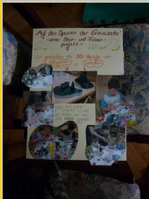
„Auf den Spuren der Grauwacke – unser Stein- und Felsenprojekt“ – bei bemalen der 3D - Modelle