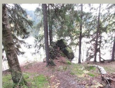
Felsenformationen Poppenstein (Felsenweg 3b) an der Talsperre in Werda

Geo-Umweltpark Vogtland Dr.-Wilhelm-Külz-Str. 25 08223 Falkenstein/Vogtland www.sagenhaftes-vogtland.de