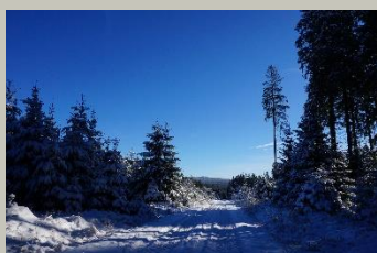
Felsenweg 1 im Winter

Geo-Umweltpark Vogtland Dr.-Wilhelm-Külz-Str. 25 08223 Falkenstein/Vogtland www.sagenhaftes-vogtland.de