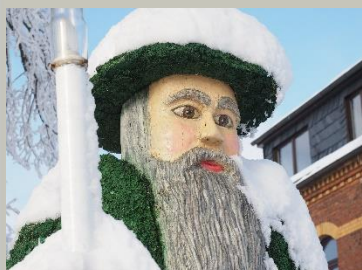
Moosmann in Grünbach