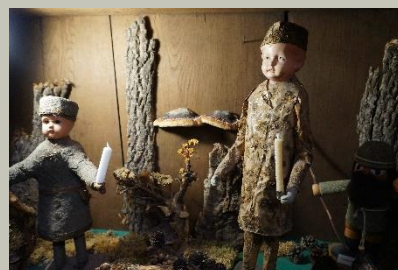
Moosmännchen im Heimatmuseum Falkenstein

Geo-Umweltpark Vogtland Dr.-Wilhelm-Külz-Str. 25 08223 Falkenstein/Vogtland www.sagenhaftes-vogtland.de