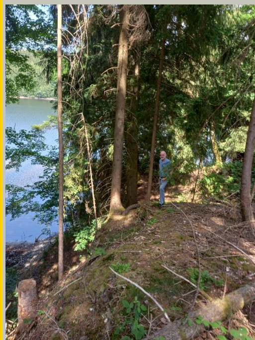
Geotopbegehungen im Raum Werda