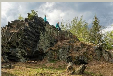
Katzenstein /Brandfelsen (FS 3b)