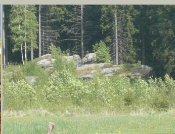
Genesenstein (FW 1)

Geo-Umweltpark Vogtland Dr.-Wilhelm-Külz-Str. 25 08223 Falkenstein/Vogtland www.sagenhaftes-vogtland.de