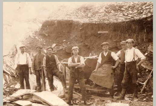
Plattenbruch in Theuma, 1905