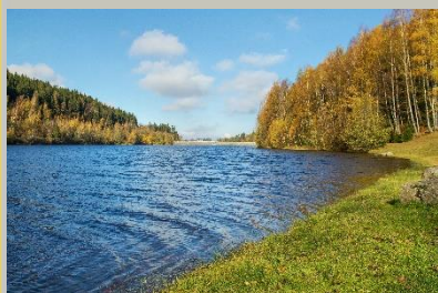
Talsperre Falkenstein