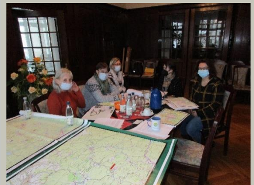
Gemeinsam zum neuen Felsenwegflyer