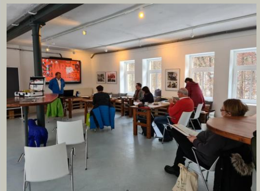
Gemeinsamen Arbeitstreffen in Dorfhain