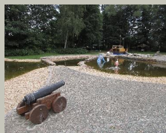
Kindermatschplatz in Schönau

Geo-Umweltpark Vogtland Dr.-Wilhelm-Külz-Str. 25 08223 Falkenstein/Vogtland www.sagenhaftes-vogtland.de