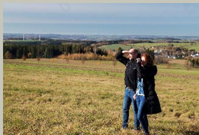
Felsenweg 3a / Eimberg Vogtlandblick