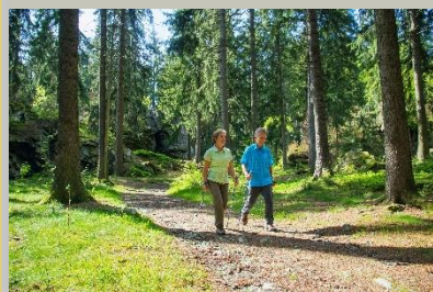
Felsenweg 1 / Wanderer vor dem Wendelstein

"Der Abbau von Fruchtschiefer im Gebiet um Theuma und Tirpersdorf im sächsischen Vogtland und seine Verwendung"