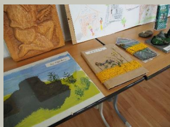
Die Gruppenarbeiten der Kindergärten