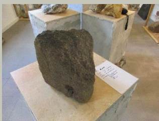
Basalt; Markneukirchen Mineralienzentrum