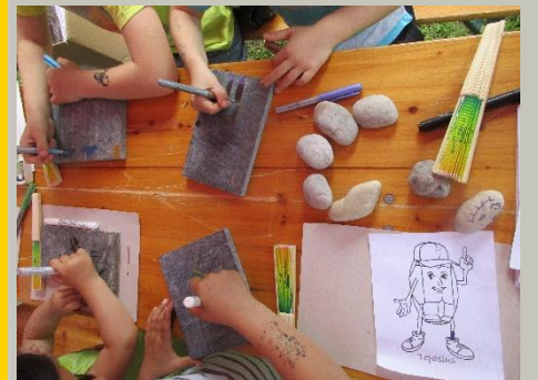
Familientag in Falkenstein – Malen auf Fruchtschiefer