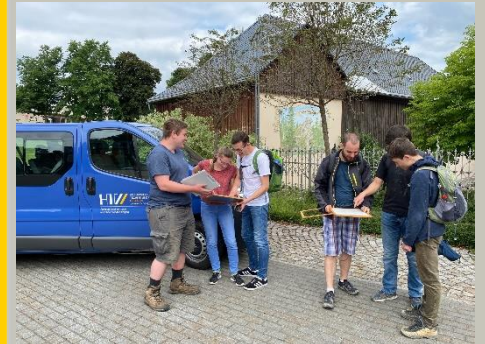
Studenten der HTW – Dresden bei der Arbeit