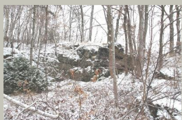
Auflässiger Steinbruch „Roter Bühl“ in Bergen vor und nach der ersten Inwertsetzung durch die Gemeinde