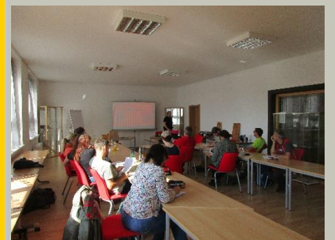
ZNL – Ausbildung zur Geologie mit Dr. Alexander Repstock