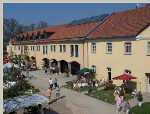
Teichfest im NUZ