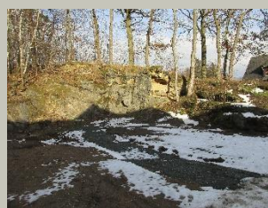
Roter Brühl, Bergen

Geo-Umweltpark Vogtland Dr.-Wilhelm-Külz-Str. 25 08223 Falkenstein/Vogtland www.sagenhaftes-vogtland.de