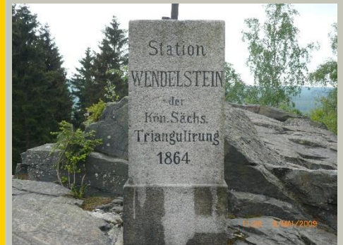
Wendelstein mit Triangulierungssäule (Station 142)