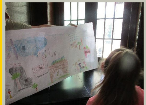
Ein Super – Riesenbild von der Käfergruppe