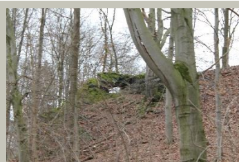
„Felsenbrücke“; Elfelder Park