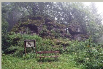
Hirschenstein; Klingenthal © Klingenthal