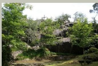
Wendelstein