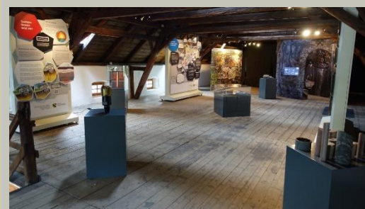
„Sachsen hebt seine Schätze“ – Bild aus Schlettau